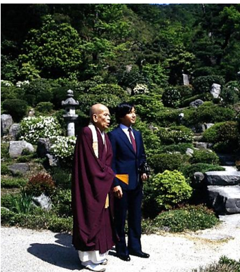
▲皇太子殿下 西福寺 ※右、当時 昭和58年5月10日 68892