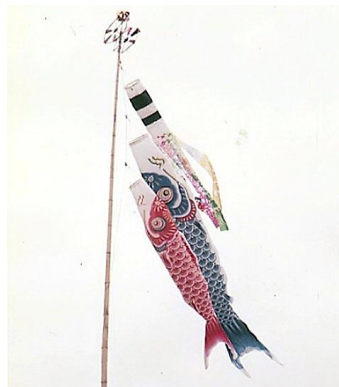
▲鯉のぼり 昭和45年5月13日 60085